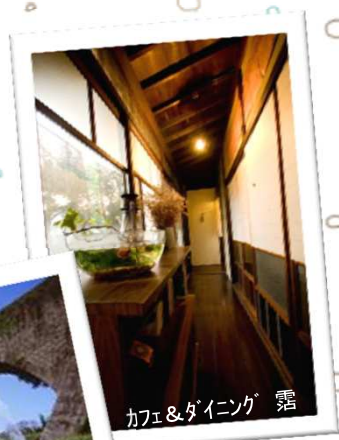
カフェ＆ダイニング 雷